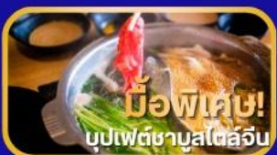
มือพิเศษ! บุปเป็ดชาบูสไตส์จิ้น