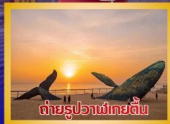
ต่ายรูปวาฬยักษ์ตื่น

สะพานจันเจียว-โบสถ์คาทอลิกชิงเต่า (ชมภายนอก)-ป่าตึกวน- พิพิธภัณฑ์เบียร์ชิงเต่า -ถนนคนเดินไท่ตง -ผิงไห่เก๋อ-ชายหาดและ จุดถ่ายรูปปลาวาฬยักษ์ตื่น -ถนนอ้าววีป่าเจียว-ชายหาดลากลอยไห่- จัตุรัสชิงฟู่หมิน-สวนเว่ยไห่ -สวนเย่วไห่-เกาะหยางหม่าย่าน - เมือง ท่าเหยียนไถ่-ท่าเรือชาวประมงเหยียนไถ่-ภูเขาเหยียนไถ่-จัตุรัส 54 -ศูนย์ โอลิมปิกเรือใบชิงเต่า-ภูเขาเหลาซาน-วัดไท่ซิงกง-สวนเลี้ยวมวยเต่า ชายหาดทะเลหมายเลข 3-อาคารไฟ้เทียน ชั้น 81- Cyber Punk