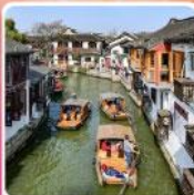
หมู่บ้านโบราณซูเจียเจี๋ย