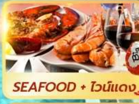
SEAFOOD + ไวน์แดง