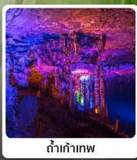
ถ้ำเก้าทพ