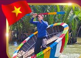
ล่องเรือกระด้ง หมู่บ้านกิมกาน