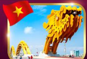
แลนด์มาร์กสะพานมังกร ดานัง