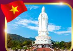
ชอปรองคักวอนอิม วัดหลินอึ้ง