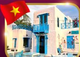
คาเฟ่สไตล์ซานโตรินี่ ซันทรา มาริน่า