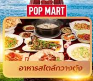
POP MART อาหารสไตล์กวางตุ้ง