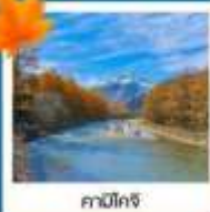
คามิโกจิ