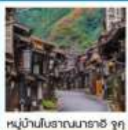
หมู่บ้านโบราณมาราชิ จุกุ