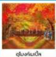
อุโมงค์เมเน็ค