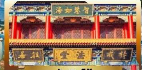
วัดจิ้นไ้