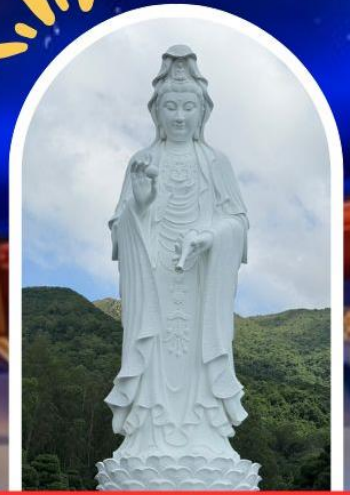
วัดซีซัน