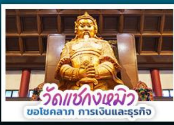
วัดแห่งกวมิว ขอโชคลาภ การเงินและธุรกิจ