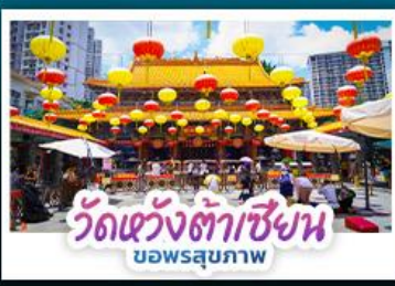
วัดแห่งต้าเซียน บอพรสุขภาพ