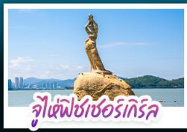
จุฬาราชมนตรี