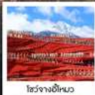
โชว์จางอีหนว

พิเศษ!! รวมค่าเช่าชุดพื้นเมือง ...ที่เมืองโบราณลี้เจียง