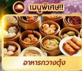
เมนูพิเศษ!! อาหารกวางตุ้ง