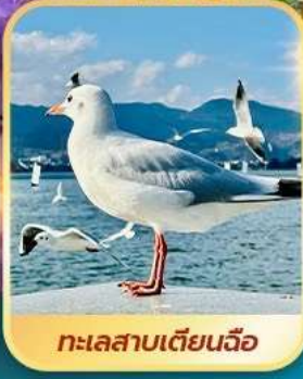
ทะเลสาบเตียนฉือ