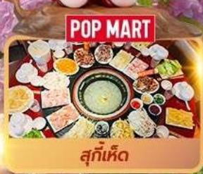
POP MART สุกี้เห็ด