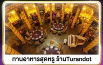
กานอาหารสุดหรู ร้านTurandot