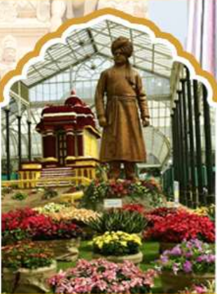
บังกาลอร์