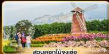
สวนดอกไม้จงเซ่อ