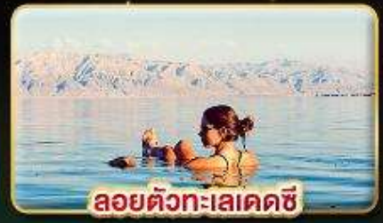
ลอยตัวทะเลเดคซี