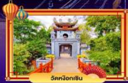
วัดม็อกอิน