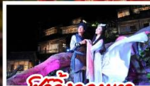
ชีวิตจิ้งจอกขาว