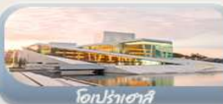
โอปราเฮาส์

สักครั้งในชีวิตกับการนั่งรถไฟสายโรเมนติกฟลัมสบาน่า สองเรือชมฟยอร์ด ขึ้นกระเช้าลอยฟ้าพิชิตยอดเขาอูสริเคน เบอร์เกน นั่งรถรางสวยอดเขาฟลอมอนชมวิวเมือง ออสโล เยี่ยมชมโอปราเฮาส์ มหาวิหารออสโล ป้อมปราการอาครส์ฮูส สวนมนุษย์ชาติ Vigeland Sculpture Park