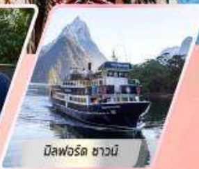
มิสฟอร์ด ซาวนี