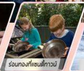
ร้อนท้องที่แซนดี้ทาวน์