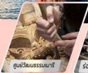
ศูนย์วัฒนธรรมเมารี