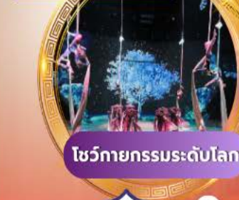
โชว์กายกรรมระดับโลก