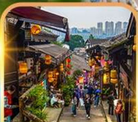
หมู่บ้านโบราณฉือชี่โจว