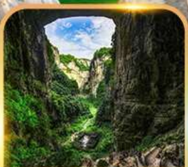
อุทยานหลุมฟ้า 3 สะพานสวรรค์