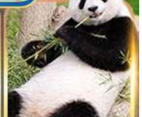
สวนสัตว์จงชิ่ง