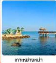
เกาะหย่างหม่า