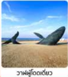
วาฬผู้โดดเดี่ยว

ไฮไลท์...เที่ยวแดนมังกรฟีลยุโรป เมืองชายฝั่งทะเลเหลือง ชมสะพานจันเจียว และพิพิธภัณฑน์เกีเปียร์