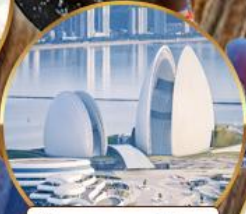
โรงแรมหรูไฮมุก