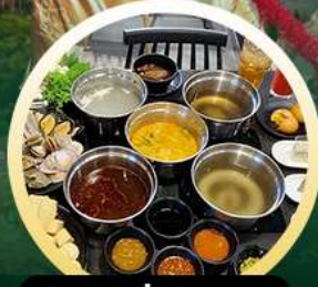
ชาพูฮ่องกง