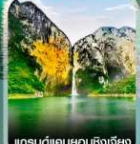
แกรนด์แคนยอนซิงเจียง