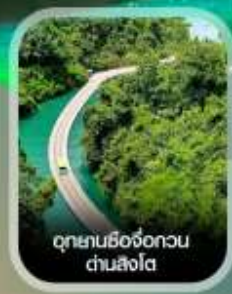
อุทยานซีจื่อถกวน ด่านสิงโต

เช็กอิน เมืองโบราณเซวียนเอน ชมความงามยามค่ำคืน สัมผัสมหัศจรรย์ ถ้ำหลงหลินกง ธารน้ำสิมรดกใสราวกระจก แกรนด์แคนยอนผิงซาน ล่องเรือชมธรรมชาติ แกรนด์แคนยอนซิงเจียง