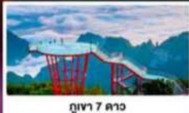
กุเวา 7 ดาว