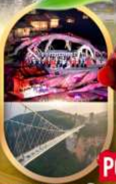
OPTION 1 : ไร่วังผางฟางจิ้งจอกขาว OPTION 2 : สระพญากิ่งจางเจียเจีย