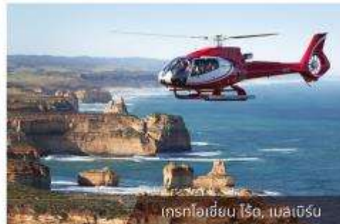
เฮลิคอปเตอร์บิน ไรต์, เมลเบิร์น