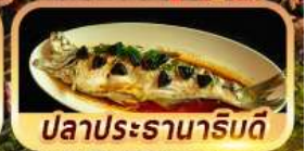
ปลาประรานาภิรมย์