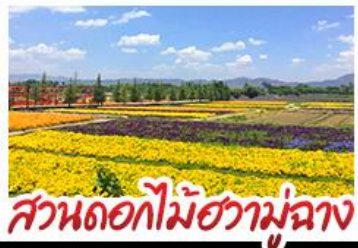
สวนดอกไม้ฮวาหู่เมือง