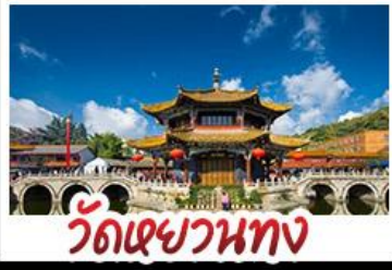
วัดเขวหนง

ถนนสายสีม่วงดอกศรีตรังและลาเวนเดอร์ ภูเขาพระจันทรส์น้ำเงิน - ภูเขาหิมะมังกรหยก เมืองโบราณลี่เจียง - สวนดอกไม้ฮวาหู่เมือง รถไฟความเร็วสูง - วัดหยวนทง - รถไฟความเร็วสูง พักโรงแรมระดับ 4 ดาว - KUNMING OLD STREET เมนูพิเศษ สุกีปลาแซลมอน สุกีหัด อาหารกวางตุ้ง