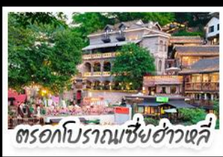
ตรอกโบราณเซี่ยฮ่าวหลี่