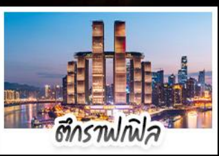
ตึกรูปไฟฟ้