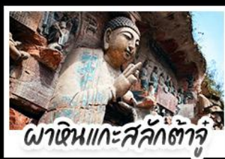
พาเดินแกะสลักคำจู้