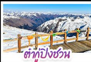
ต้ากู่ปิงชวณ