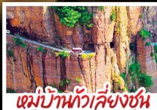
หมู่บ้านทิวสียงซุน