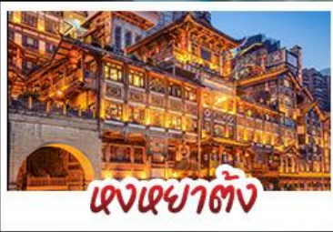
ตงเซาตัง