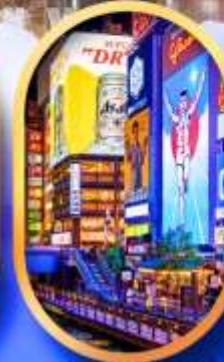
ย่านชิบะฮาชิจิ