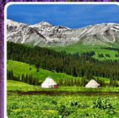
ทุ่งหญ้านาฬิกา