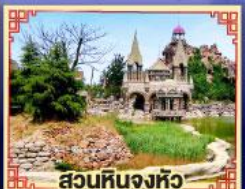
สวนหินงูหวู่