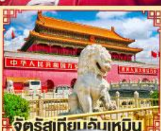
จัตุรัสเทียนจันเหมิน