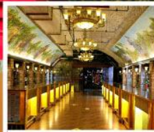
พิพิธภัณฑ์ไวน์ชิงเต่า