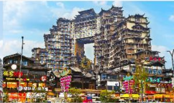
ตีทมห้ศจสรร์ย 72