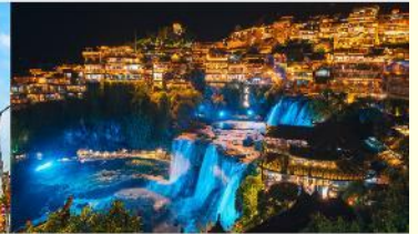
หมู่บ้านโบราณฟูหรงเจิน

*ทางบริษัทฯ ขอสงวนสิทธิ์ในการสลับโปรแกรมทัวร์ตามความเหมาะสมขึ้นอยู่กับสถานการณ์หน้างาน โดยคำนึงถึงผลประโยชน์ของลูกค้าเป็นสำคัญ