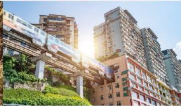
รถไฟฟ้าทะเลตุ๊ก