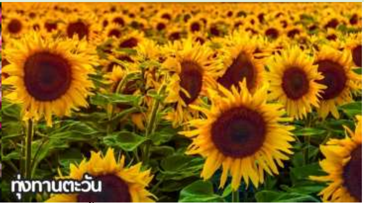
ทุ่งทานตะวัน

จากนั้นนำท่านสู่ ถนนหวังฝูจิ่ง ถนนคนเดินสุดฮิตใจกลางกรุงปักกิ่ง ปัจจุบันถนนนี้เป็นที่นิยมมากในหมู่นักช้อปปิ้งและนักท่องเที่ยวที่ตบเท้าเข้ามาเพื่อเสาะหาของลดราคาและเสื้อผ้าที่มีเอกลักษณ์ไม่ซ้ำใคร ถนนการค้าที่พลุกพล่านแห่งนี้มีมีมานั่ง บาร์ ร้านอาหาร และคาเฟ่เรียงรายตลอดทางอยู่บนถนนคนเดินสายนี้ ให้ท่านได้ช้อปปิ้งร้าน Pop Mart ที่ใหญ่ที่สุดในปักกิ่งตุ๊กตา box หน้าตาน่ารักที่ดังที่สุดในจีนตอนนี้ ต้องยกให้กับ Pop Mart