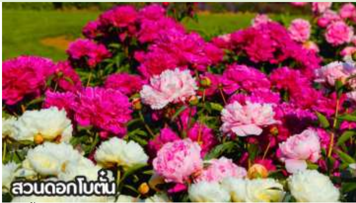
สวนดอกไม้ต้น

เดือนสิงหาคม-ต้นกันยายน ชมทุ่งดอกเบญจมาศหรือดอกไฮเดรนเยีย ดอกเบญจมาศปักกิ่งหมายถึงสายพันธุ์เบญจมาศที่มีต้นกำเนิดหรือนิยมปลูกในกรุงปักกิ่ง ประเทศจีน โดยเฉพาะช่วงฤดูใบไม้ร่วง ที่มีการจัดงานมหกรรมดอกเบญจมาศ แสดงความหลากหลายของสีและรูปทรง มีสายพันธุ์เช่น "กุสุยจินเสี่ย" ที่ได้รับรางวัลราชาดอกเบญจมาศ และยังมีเบญจมาศปักกิ่งสีขาวที่เป็นสมุนไพรด้วย ที่สำคัญคือเป็นดอกไม้ที่ใช้ในงานเทศกาลและวัฒนธรรม โดยเฉพาะในสวนสาธารณะ เช่น รือถาน และอุทยานเป่ย์ไห่ มีหลากหลายสี เช่น ขาว เหลือง ชมพู แดง และม่วง สามารถพบได้ในหลายพื้นที่