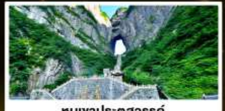
ทิวเขาประตูสวรรค์