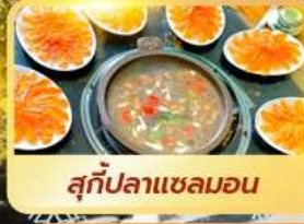
สุกี้ปลาแซลมอน