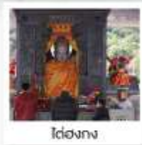
ไถ่ฮ่องกง