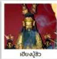
เซียงบู๊ฮิว