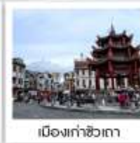
เมืองเก๋าสือเถา