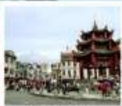
เมืองเก๋าชิวเถา