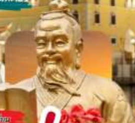
วัดของฮกเกี้ยน