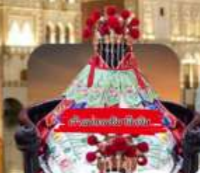
วัดของเซี่ยงไฮ้