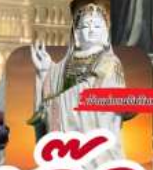
วัดของไต้หวัน