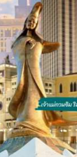
เจ้าแม่กวนอิม วิมตะเจี๊ว