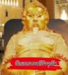
วัดของฮ่องกง