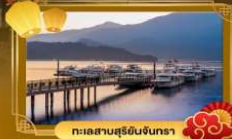
ทะเลสาบสุริยอินจันตรา