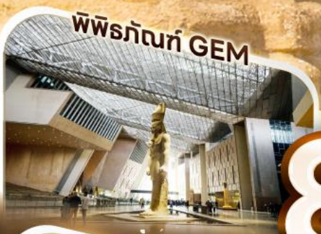
พิพิธภัณฑ์ GEM