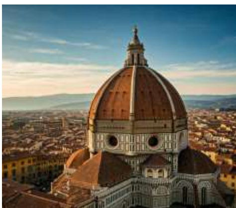
Duomo di Firenze

Piazza della Signoria: จตุรัสกลางเมืองที่รายล้อมไปด้วยอาคารสำคัญต่างๆ