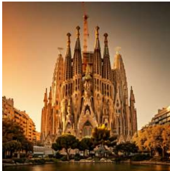
Sagrada Família barcerona spain

มหาวิหารซากราดาแฟมิลี (Sagrada Família): สัญลักษณ์ของบาร์เซโลนาและผลงานชิ้นเอกของเกาดีที่ยังสร้างไม่เสร็จ แต่ก็สวยงามตระการตาด้วยสถาปัตยกรรมที่แปลกตาและรายละเอียดที่ประณีต