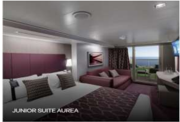
JUNIOR SUITE AUREA

Surface 17 sqm, balcony 5 sqm, deck 9-10 Sitting area with sofa Bathroom with shower or bathtub, vanity area with hairdryer Comfortable double or single beds (on request) Interactive TV, telephone, Wifi connection available (for a fee), safe and minibar