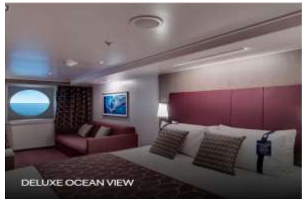
DELUXE OCEAN VIEW

Surface 14 sqm, deck 5-10 Bathroom with shower, vanity area with hairdryer Comfortable double or single beds (on request*) Interactive TV, telephone, wifi connection available (for a fee), safe and minibar Can accommodate up to 5 people