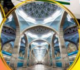
รถไฟฟ้าใต้ดิน